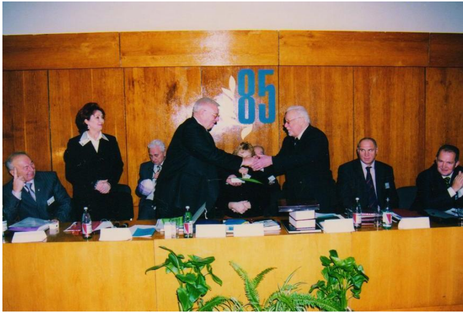
Рис. 11. 85-річний ювілей кафедри загальної гігієни Дніпропетровської медичної академії, 2007 р.