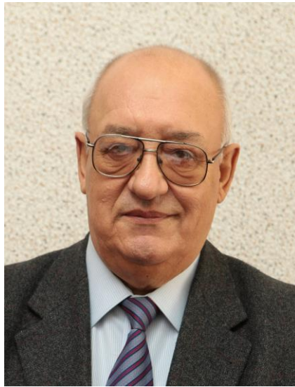
Рис. 8. Е.А. Деркачов

На початку 2000-х років колектив кафедри активно працював над розробкою наукових основ та гігієнічних принципів охорони довкілля і системою реабілітації ґрунту від впливу важких металів. Багаторічна плідна праця науковців отримала високу оцінку нашої держави. У 2002 р. її завідуючий – професор Е.А. Деркачов – за цикл наукових робіт «Важкі метали як небезпечні для людини забруднювачі навколишнього середовища в Україні» у складі колективу провідних вітчизняних гігієністів був нагороджений Державною премією України.