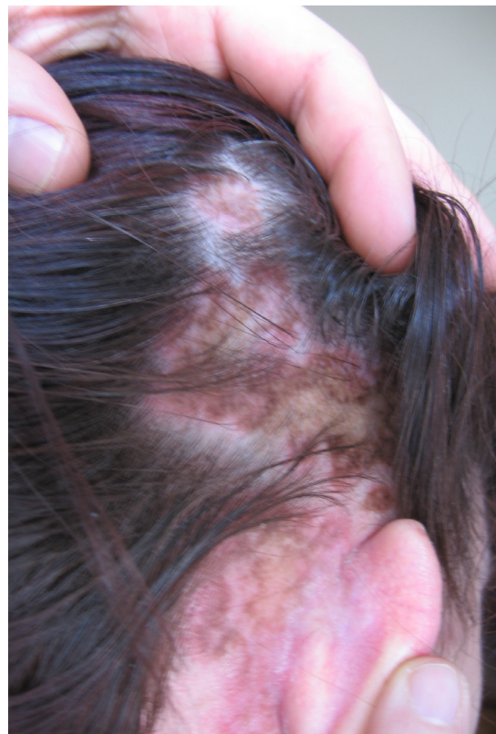
Рисунок 3. Макрофотография ДКВ волосистой части головы.