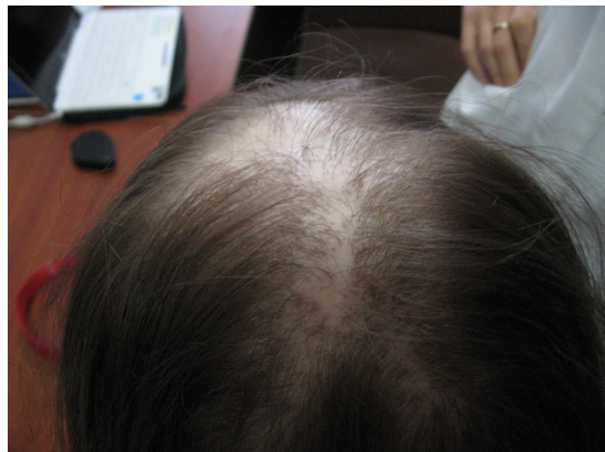
Рисунок 1. Макрофотография Псевдопелады Брока.