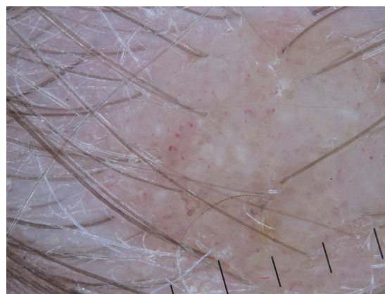
Рисунок 4. Дерматоскопическая картина при ДКВ волосистой части головы.