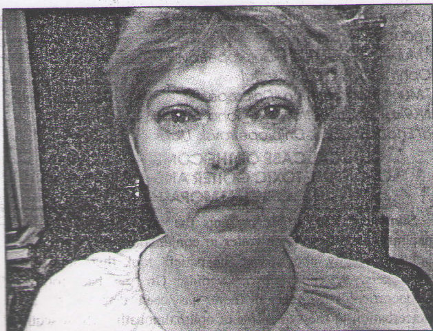
Рисунок 3. Пациентка И. через 2 месяца после транспальпебральной декомпрессии правого глаза

УЗИ орбит (10.01.2011): ретробульбарная клетчатка справа однородной структуры, обычной эхогенности с единичными мелкими фиброзными включениями, слева — неоднородной структуры, обычной эхогенности с множеством фиброзных включений. Некоторое уменьшение ПЗР справа до 19,7 мм, слева — до 22,7 мм. Продолжает уменьшаться диаметр экстраорбитальных