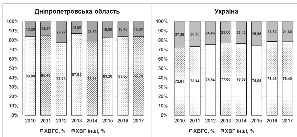
Рис. 1. Питома вага хронічного вірусного гепатиту С та інших хронічних вірусних гепатитів – В, D, В+D в загальній структурі захворюваності на ХВГ у Дніпропетровському регіоні та Україні за 2010–2017 рр.

Як видно з рисунка 3, рівень захворюваності на ХВГС та ХВГ у цілому в Україні має чітку тенденцію щодо