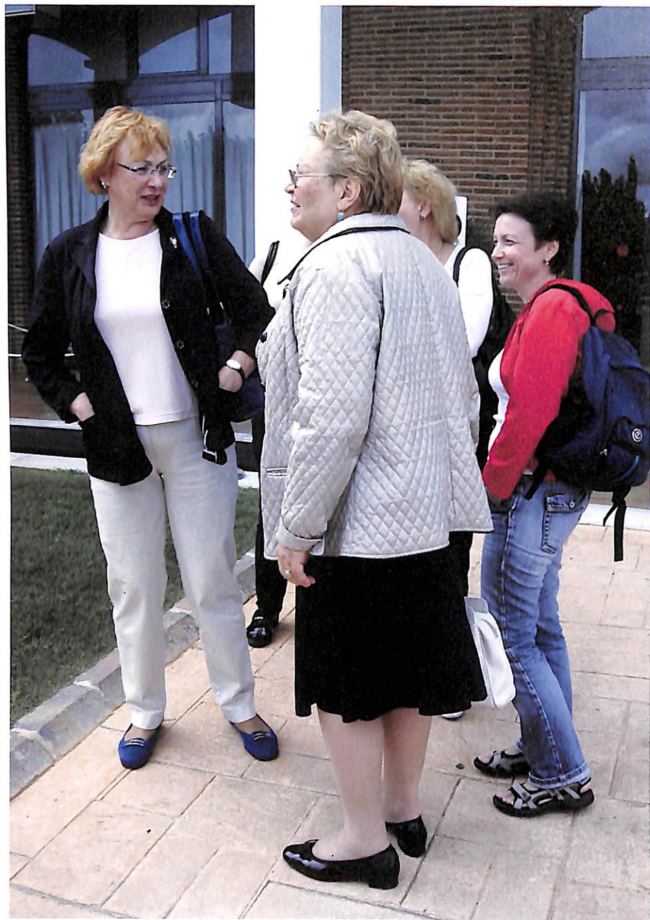
З колегами на екскурсії під час проведення 20 Конгресу Європейського респіраторного товариства (поблизу м. Барселона, 2010 р.)