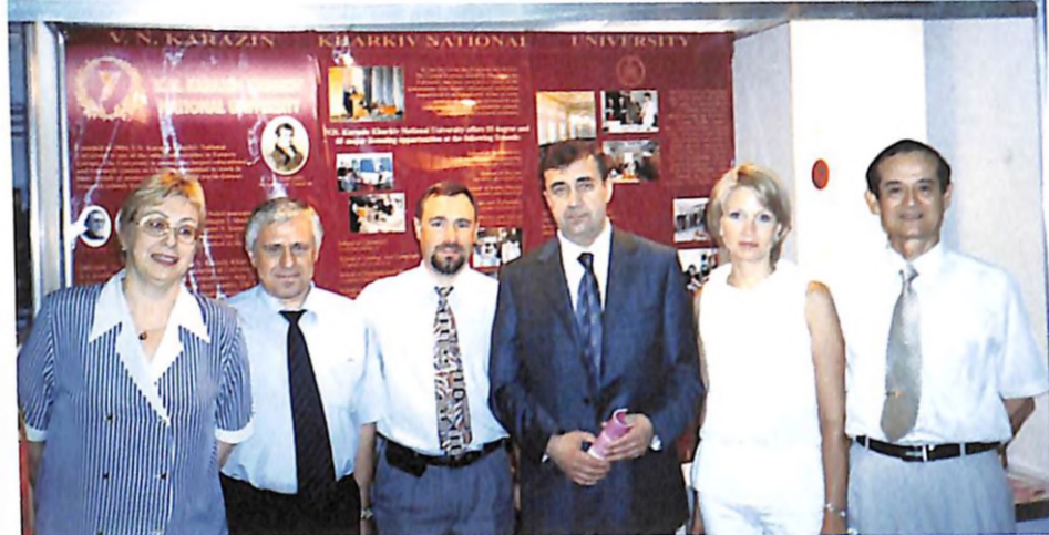
На міжнародній виставці з освіти (м. Пекін, 2004 р.)