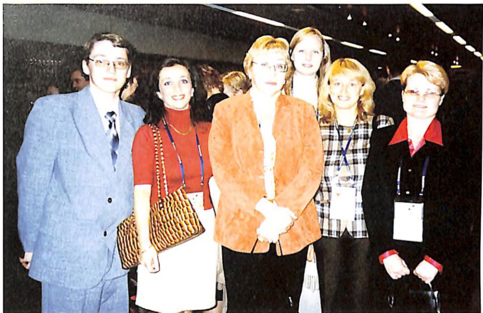
З учнями й співробітниками кафедри факультетської терапії та ендокринології на 13 Конгресі Європейського респіраторного товариства (м. Відень, 2003 р.)