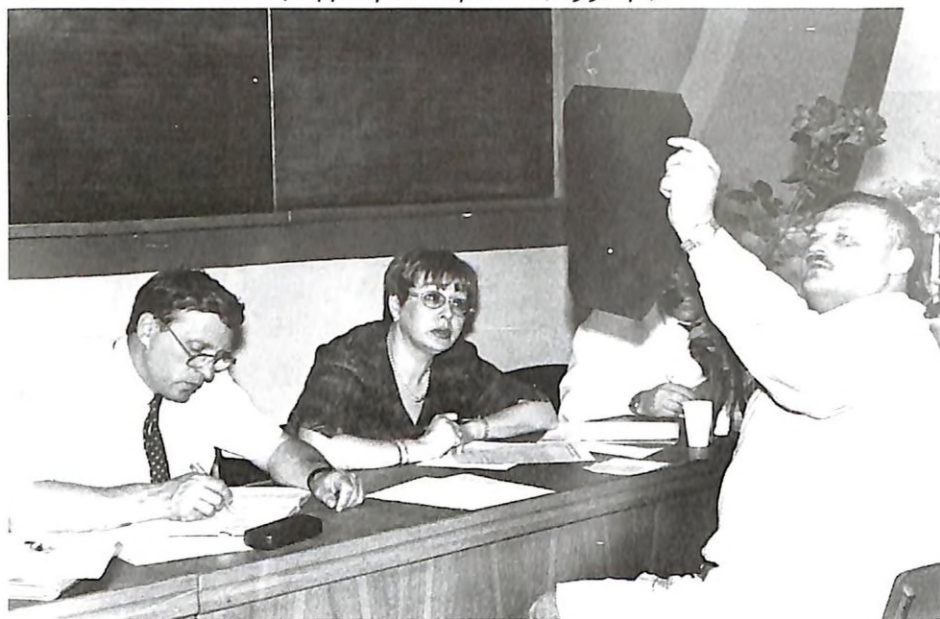
На держвному іспиті з терапії (1990 р.)