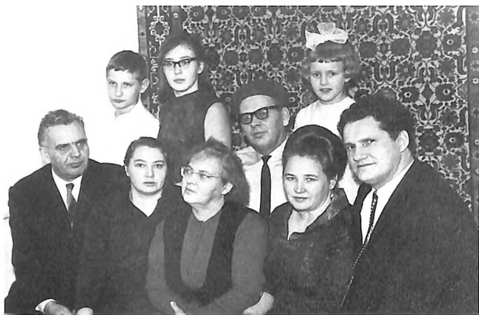
У родинному колі (1969 р.)