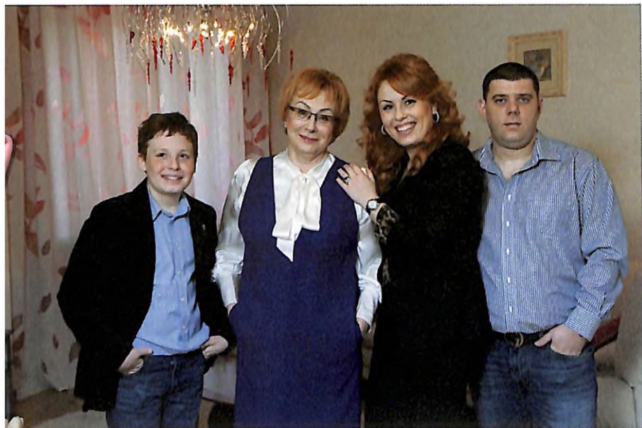
У родинному колі (2012 р.)