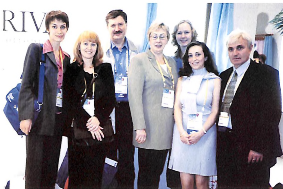
З колегами-пульмонологами на 12 Конгресі Європейського респіраторного товариства (м. Стокгольм, 2002 р.)