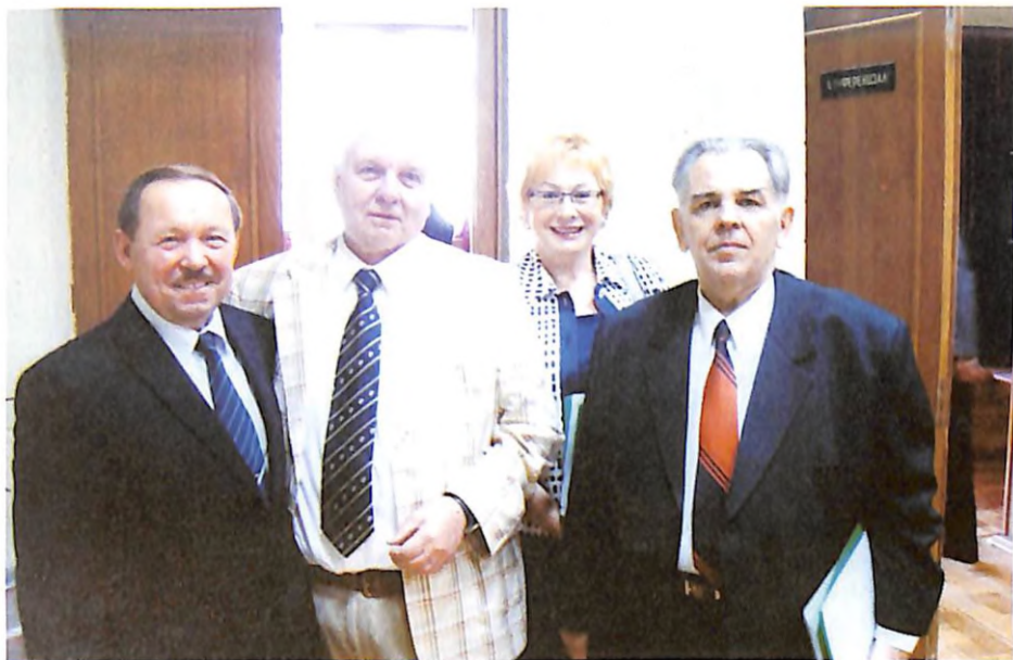
На засіданні НАМН України з академіком НАМН України В. М. Коваленком, академіком НАМН України Г. В. Дзяком та членом-кореспондентом НАМН України О. В. Люльком (м. Київ, 2011 р.)