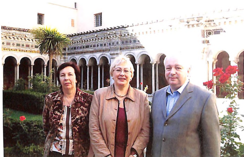
На конференції з пульмонології (м. Рим, 2006 р.)