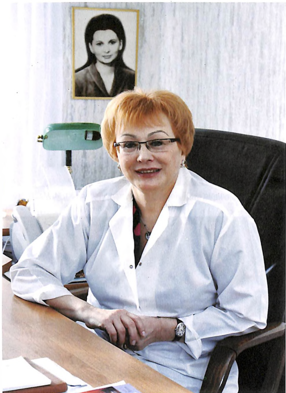
На робочому місці (м. Дніпропетровськ, 2008 р.)