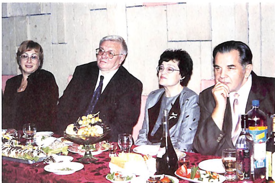
На святкуванні 85 річниці Дніпропетровської державної медичної академії (м. Дніпропетровськ, 2001 р.)