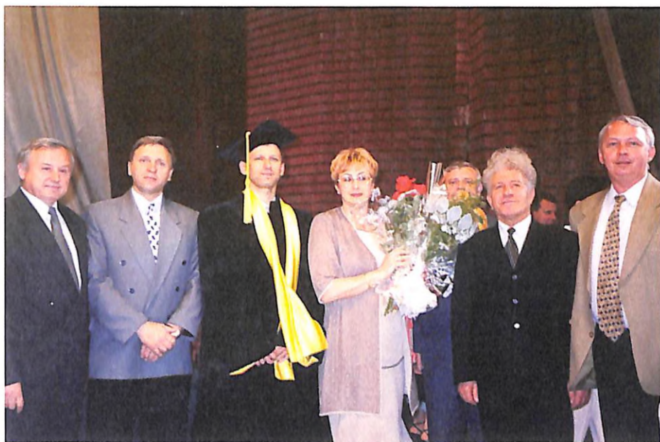
Випуск лікарів Дніпропетровської медичної академії (2002 р.)