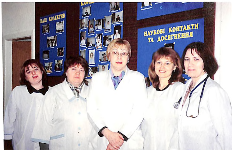
З колегами на кафедрі (2002 р.)