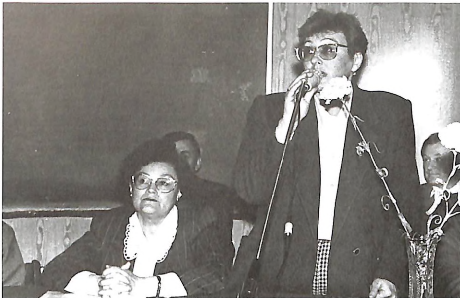
На конференції молодих вчених (м. Дніпропетровськ, 1993 р.)