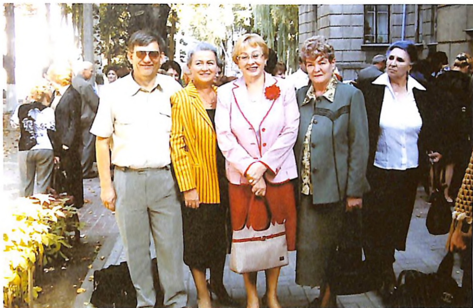
На зустрічі випускників вузу (м. Дніпропетровськ, 2005 р.)