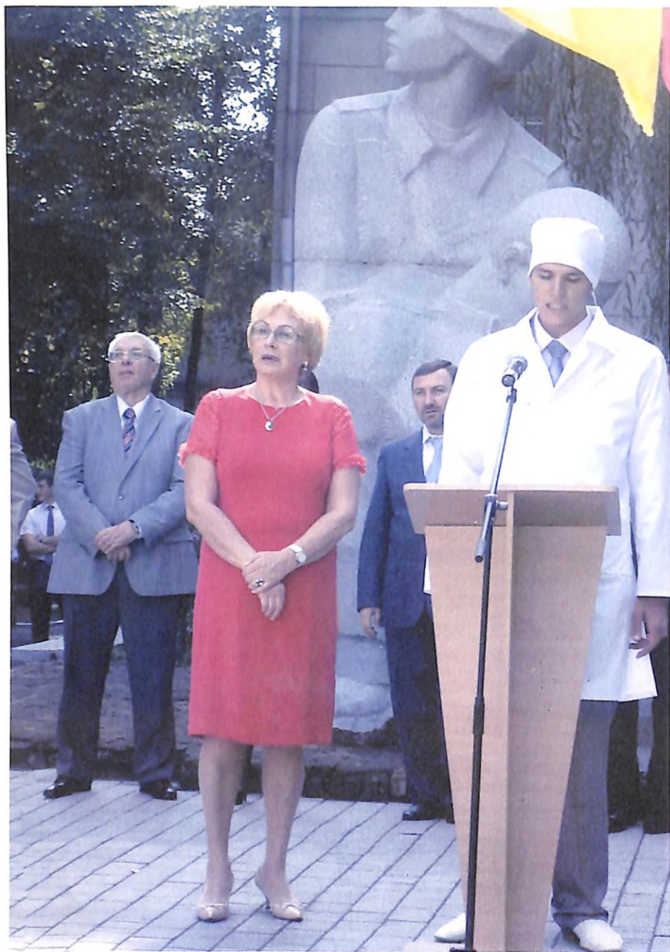
На посвяченні у студенти (м. Дніпропетровськ, 2011 р.)