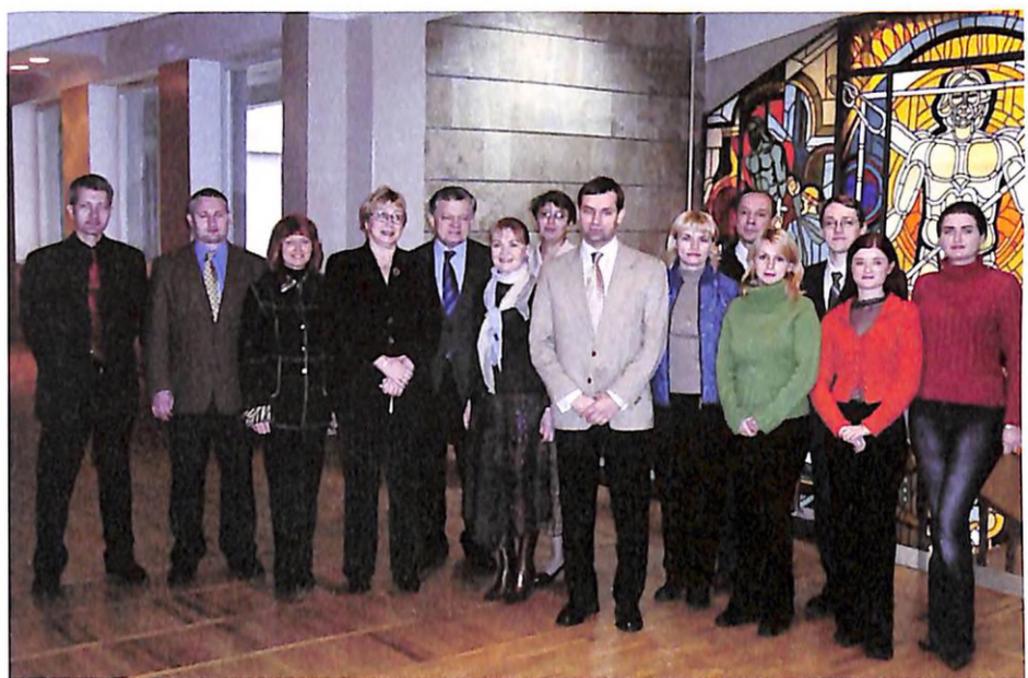
З колегами та учнями на Конгресі з антибактеріальної терапії (м. Дніпропетровськ, 2004 р.)