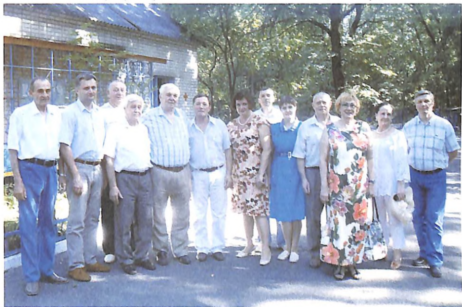
Після закінчення роботи приймальної комісії (оздоровчий табір вузу, 2010 р.)