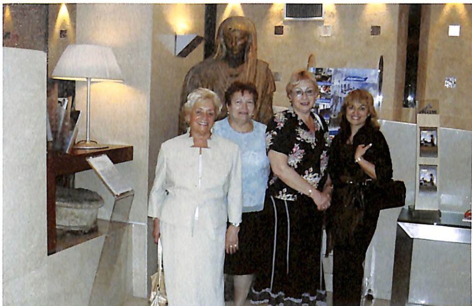
З колегами-пульмонологами (м. Рим, 2006 р.)