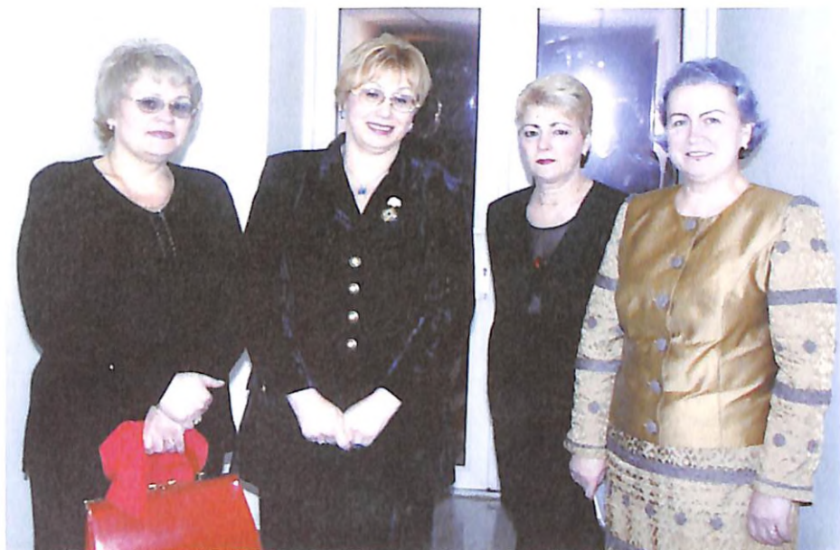
З подругами (м. Дніпропетровськ, 2002 р.)