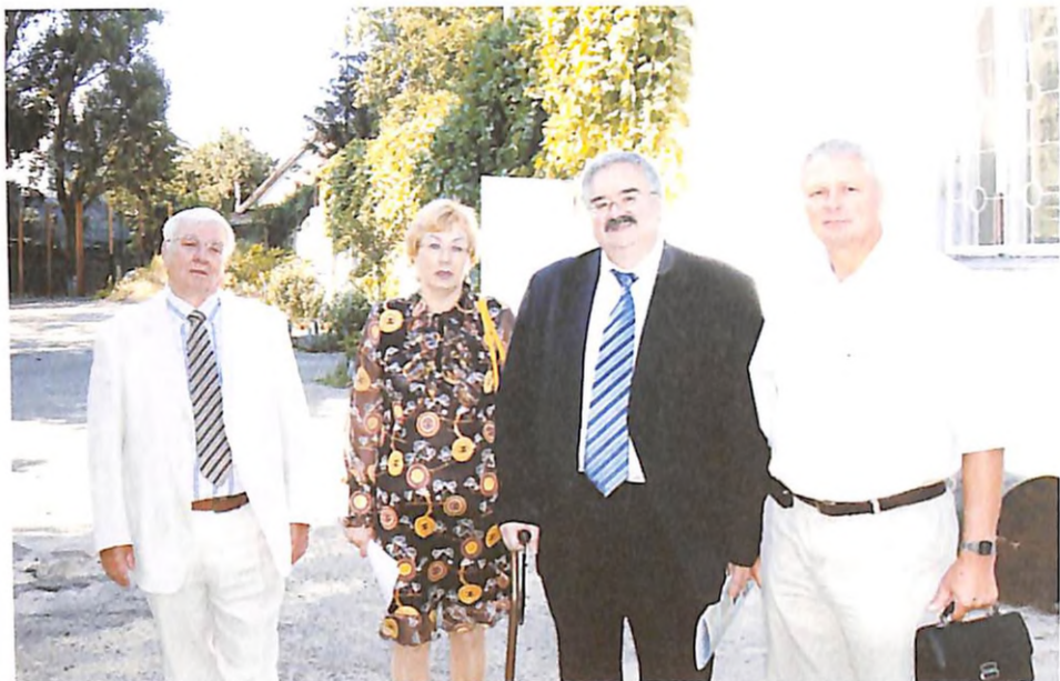
Перед серпневою нарадою з академіком НАМН України Г. В. Дзяком, членом-кореспондентом НАМН України О. П. Волосовцем та професором В. Й. Мамчуром (м. Дніпропетровськ, 2009 р.)