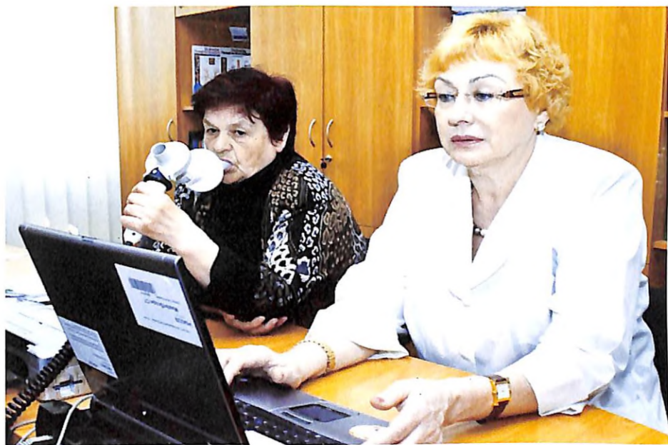
З пацієнткою під час проведення спірометрії (м. Дніпропетровськ, 2009 р.)