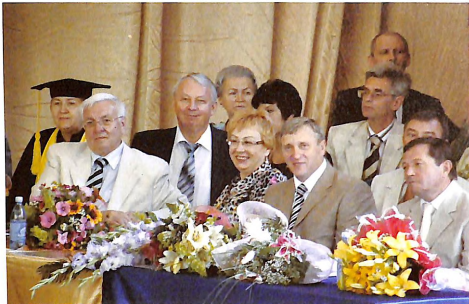
Під час урочистого випуску студентів Дніпропетровської медичної академії (м. Дніпропетровськ, 2007 р.)