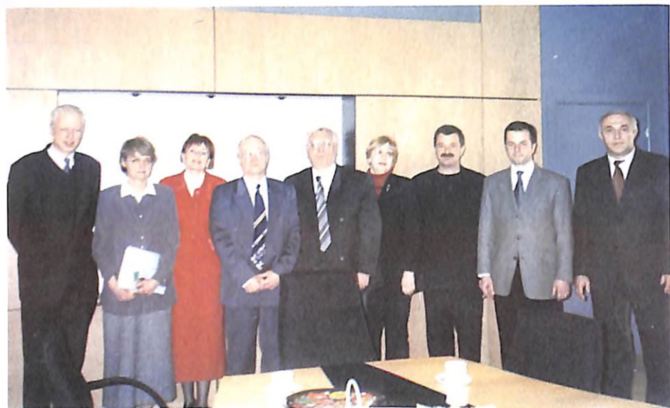
Делегація Дніпропетровської медичної академії під час знайомства з організацією охорони здоров'я Литви (м. Вільнюс, 2005 р.)