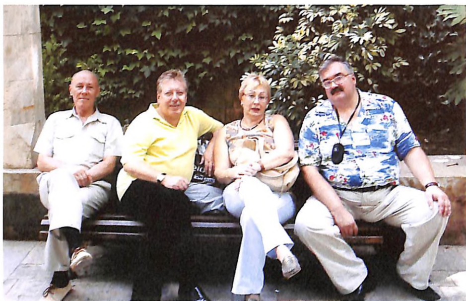
На міжнародній конференції з академіком НАМН України Ю. Г. Антипкіним, членом-кореспондентом НАМН України О. П. Волосовцем та головним педіатром МОЗ України професором В. В. Бережним (м. Пальма-де-Майорка, 2007 р.)