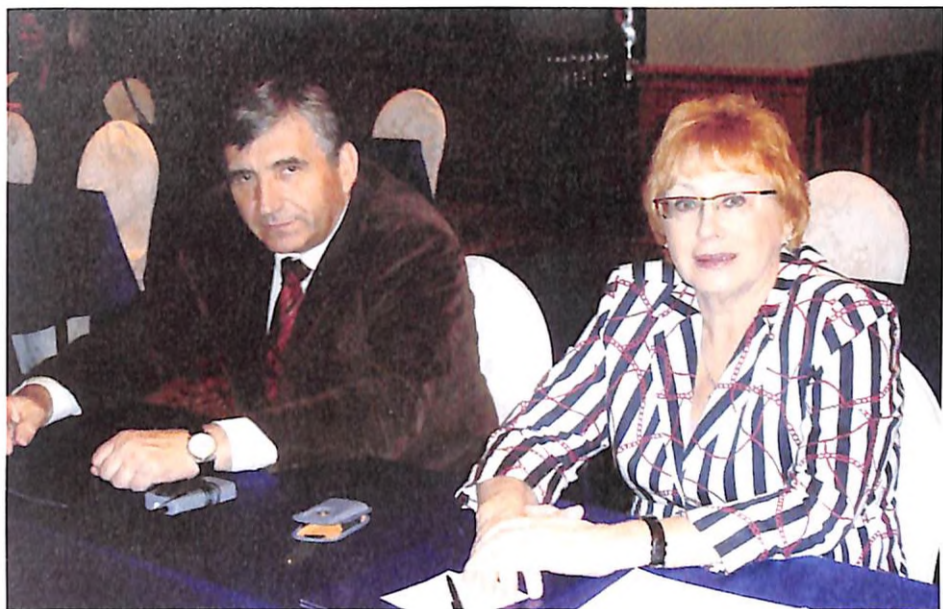
На науково-практичній конференції з академіком НАМН України Є. Г. Педаченком (2010 р.)