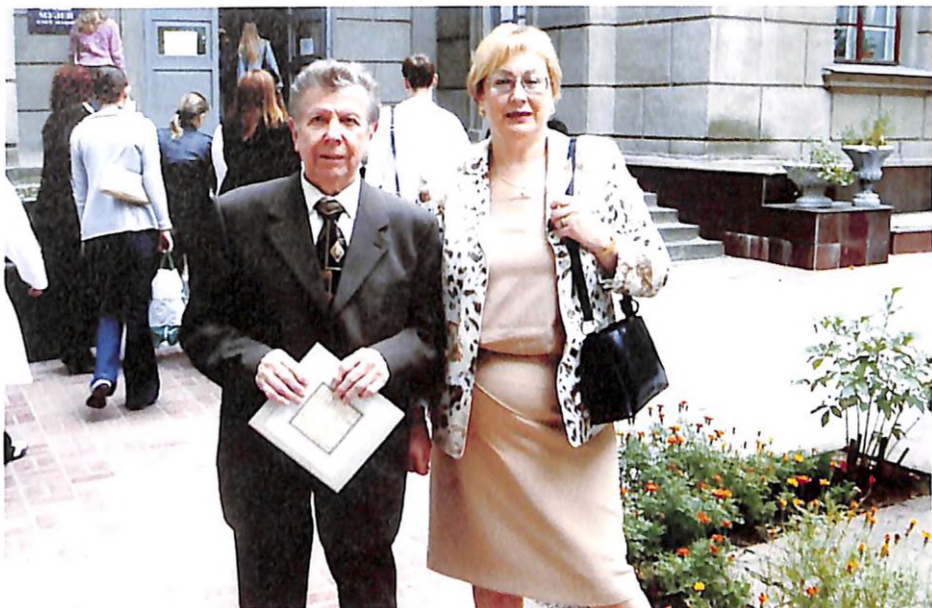
З академіком Є. І. Чазовим на Конгресі кардіологів (м. Дніпропетровськ, 2000 р.)