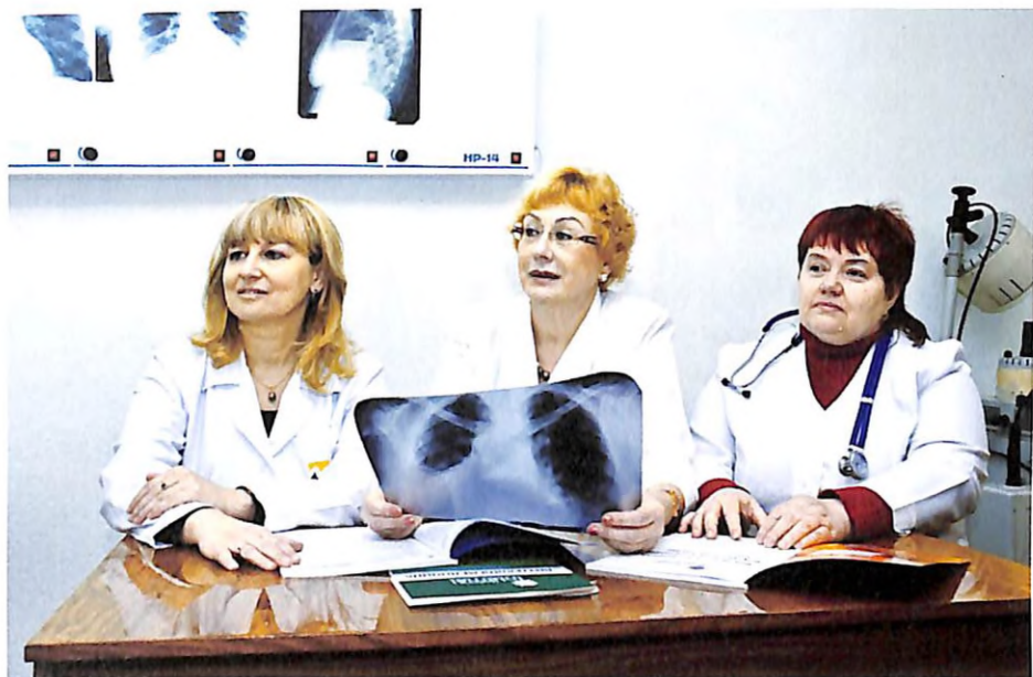
Під час розбору клінічного випадку з доцентами кафедри (м. Дніпропетровськ, 2009 р.)