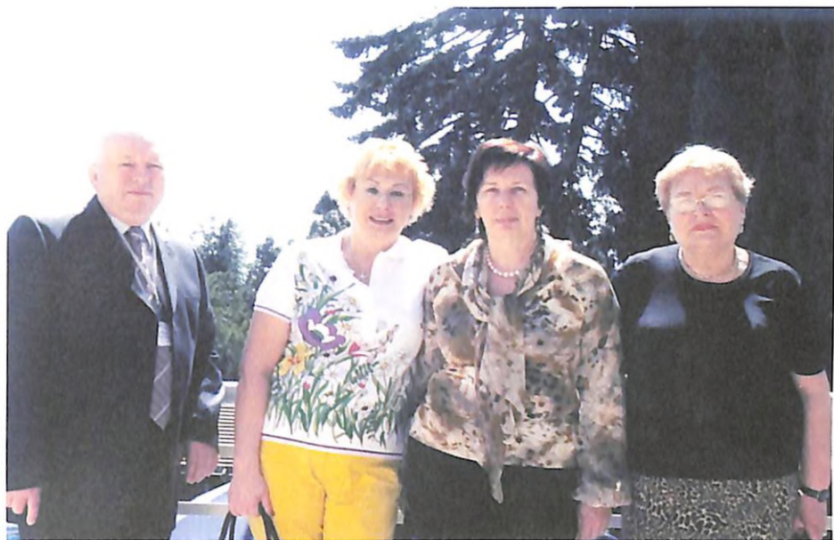
На науково-практичній конференції з академіком НАМН України Ю. І. Фещенко, членом-кореспондентом НАМН України Н. Г. Горovenko та професором Л. О. Яшиною (м. Ялта, 2010 р.)