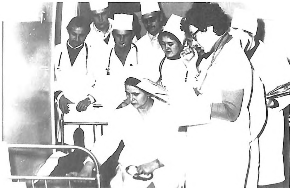
Під час клінічного огляду хворих у кардіологічному відділенні обласної лікарні ім. І. І. Мечникова (м. Дніпропетровськ, 1984 р.)