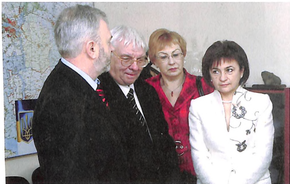
На колегії обласної ради (м. Дніпропетровськ, 2008 р.)