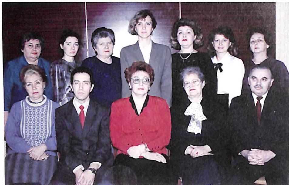
Колектив кафедри факультетської терапії та ендокринології (м. Дніпропетровськ, 1993 р.)