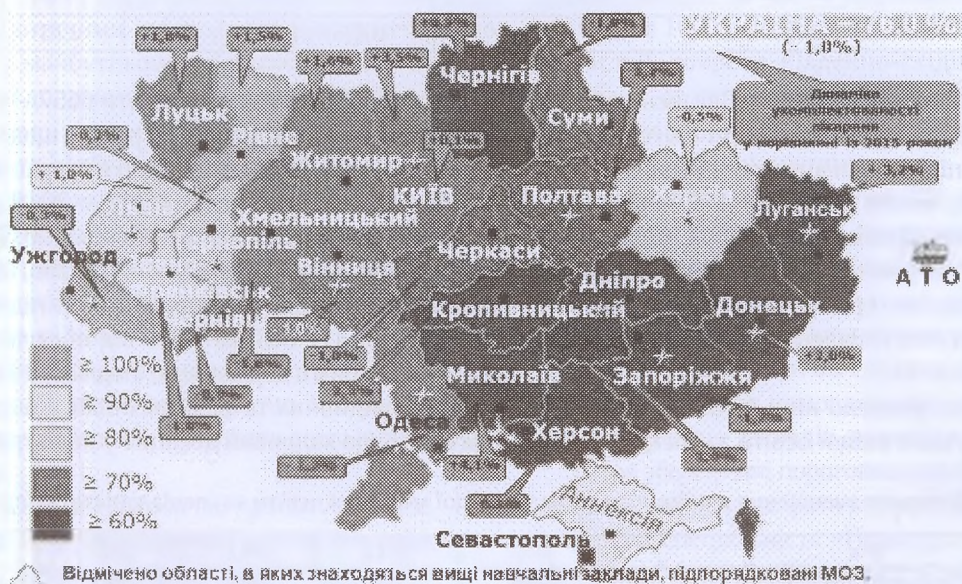
Рис. 1. Укомплектованість посад лікарями зі спеціальності «Педіатрія» за даними автоматизованої бази станом на 01.01.2018 р.

У цілому ж за останні п'ять років внаслідок низки об'єктивних факторів (окупація Криму і війна на Донбасі, втрата Кримського медичного університе-