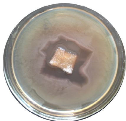
Рис. 5. Зони затримки росту P.aeruginosa ATCC 27853 під дією хлорвмісного матеріалу модифікованим методом агарових пластин.