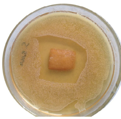
Рис. 4. Зони затримки росту S.aureus ATCC 6538 під дією хлорвмісного матеріалу модифікованим методом агарових пластин.