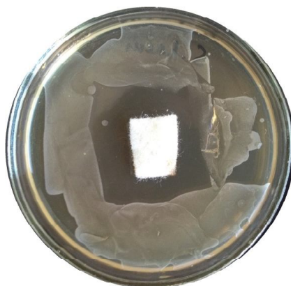
Рис. 2. Зони затримки росту E.coli ATCC 25922 під дією хлорвмісного матеріалу модифікованим методом агарових пластин.