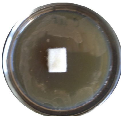
Рис. 1. Зони затримки росту C.albicans ATCC 10231 під дією хлорвмісного матеріалу модифікованим методом агарових пластин.

1. Тест-зразки іммобілізованого N-хлорсульфонаміду на сополімері стиролу з дивінілбензолом, прищепленого до поліпропіленової нитки, у формі нетканого матеріалу мають виражену антибактеріальну активність до мікроорганізмів E.coli