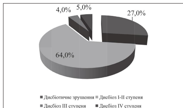
Рис. 3. Розподіл хворих з повною відсутністю зубів залежно від ступеня дисбіозу ротової порожнини, % (n=100).

1. Ураження слизової оболонки протезного ложа у хворих з повною відсутністю зубів у найближчий термін після здачі знімних протезів за візуальними проявами діагностується у 28,0%, за результатами макрогістохімічного фарбування – у 82,0 %. При цьому між інтенсивністю запального процесу та ступенем розвитку дисбіозу існує сильна кореляційна залежність ( r=0,82 , p < 0,05 ).