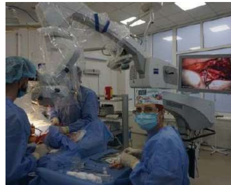
Рис. 4. Мастер-класс на тему пересадки малоберцового лоскута (а) с участием профессора В. Mankovski; демонстрация техники на атомическом материале (б), разметка дизайна перфорантного лоскута (в) и показательная операция (з)

Fig. 4. Master class on the transplantation of a peroneal flap (a) with the participation of Professor B. Mankovski; a demonstration of the technique on atomic material (b), marking the design of a perforating flap (в) and demonstrative operations (z)