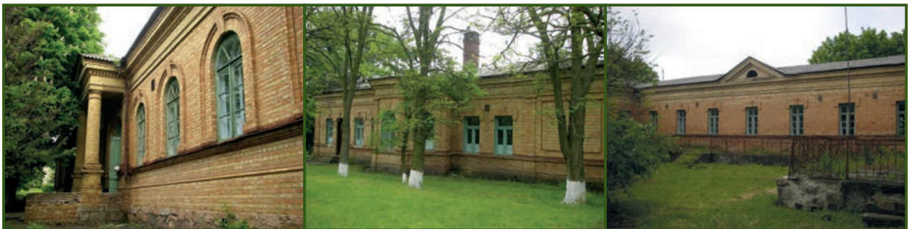
Корпуса бывшей Саксаганской земской больницы. 2009 год