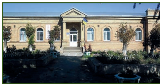
Современный вид главного корпуса Саксаганской земской больницы

Село Саксагань ныне относится к Пятихатскому району Днепропетровской области. 6 ноября 2016 года в Саксагани епископ Днепровский и Криворожский Симеон освятил храм Покровы Пресвятой Богородицы. Выстроенное земством здание Саксаганской больницы уцелело до наших дней. А еще на территории больницы сохранились деревья — немые свидетели минувших лет. Саксаганская амбулатория общей практики — семейной