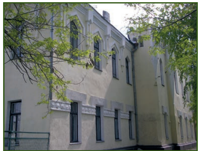
Здание бывшего Верхнеднепровского уездного земства. 2017 год

Председатель (Потоцкий): Это вопрос спорный, с одной стороны, больница действительно не богадельня, но с другой — по чувству человечества ( sic! ) нельзя оставлять умирать человека на улице» [3, с. 40-41].