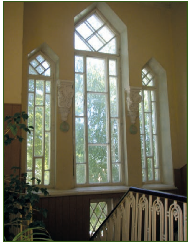
Интерьер здания бывшего Верхнеднепровского уездного земства. 2017 год