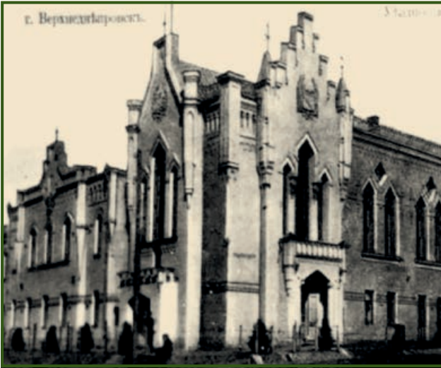
Город Верхнеднепровск. Здание уездного земского собрания. Почтовая открытка конца XIX века

Никополь и Херсон. Ежегодно проводилось пять ярмарок, на которых продавали скот, хлеб, коноплю, овощи и фрукты. На торги собиралось более тысячи человек. На саксаганские ярмарки и базары приезжали купцы из Петербурга, Москвы, Киева, Херсона, Елизаветграда, Екатеринослава.