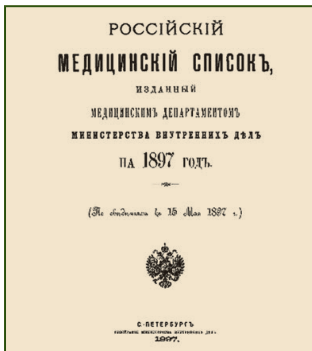
Российский медицинский список на 1897 год (титильная страница)