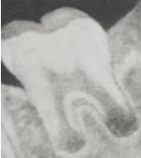
Рис. 1. Стадия роста корня в длину.