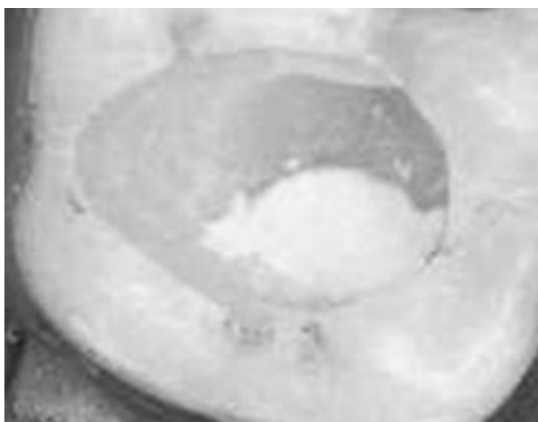
Рис. 5. Покрытие пульпы трикальцийсиликатным цементом.

Выводы. Нами установлено, что прямое покрытие незрелой пульпы трикальцийсиликатным цементом обеспечивает высокий уровень антисептики (асептическое воспаление), в результате чего происходит дифференцировка фибробластов и клеток мезенхимы в одонтобласты. В дальнейшем образуются коллагеновые волокна,