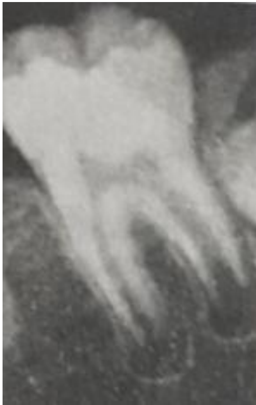
Рис. 2. Стадия несформированной верхушки корня зуба.

Лечение заключалось в том, чтобы максимально сохранить жизнеспособность пульпы и обеспечить физиологические процессы апексогенеза и апексофикации постоянных зубов с несформированными корнями.