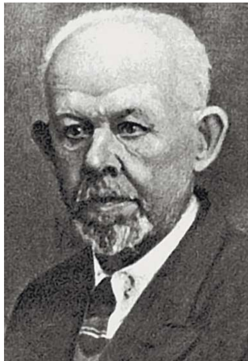
Перший ректор Катеринославської медичної академії проф. В.П. Карпов

У 1918 р. Вищі жіночі курси увійшли до складу Катеринославського університету, статут якого було розроблено і затверджено комісією під головуванням видатного вченого, академіка В.І. Вернадського. У зв'язку з реформою вищої освіти в Україні медичний факультет університету став самостійним вузом і отримав назву Катеринославська медична академія. Першим ректором призначено видатного вченого-гістолога, професора В.П. Карпова. Він залучив до академії досвідчені науково-педагогічні кадри, помітно зміцнив матеріальну базу (було придбано Олексіївський шпиталь, розпочато будівництво морфологічного корпусу), видано підручник «Начальный курс гистологии». На вшанування пам'яті першого ректора на честь 125-річчя від дня його народження було засновано наукову конференцію «Карповські читання» і медаль В.П. Карпова за найкращі науково-дослідні роботи з теоретичних дисциплін.