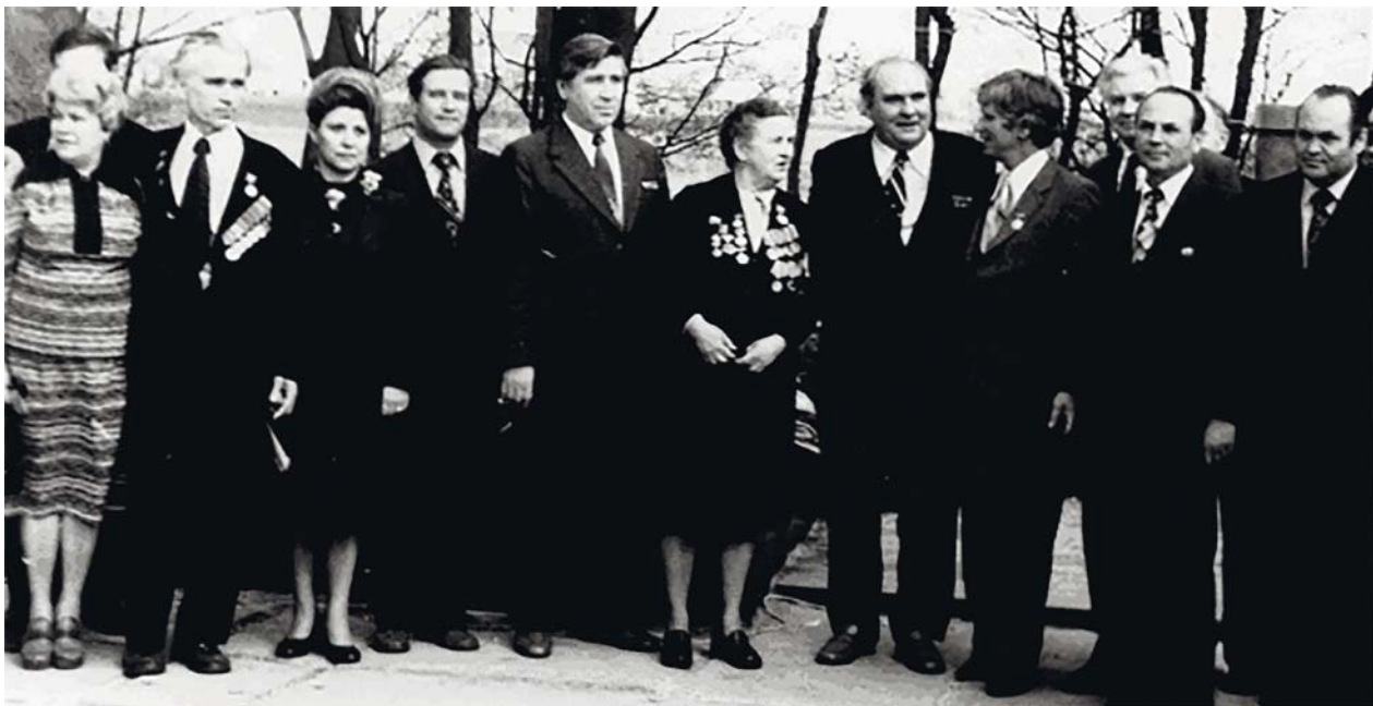
Співробітники академії на відкритті пам'ятника «Невідомому офіцеру»

У 1996 р. академію очолив академік, автор цього історичного нарису, зусиллями якого розпочався новітній рівень розвитку академії. Головним стрижнем діяльності став фундаментальний розвиток широковідомих у країні та за кордоном науково-педагогічних шкіл, які