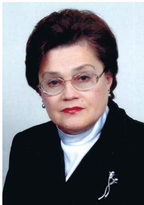
Ректор ДМА, член-кореспондент НАН та НАМН України проф. Л.В. Усенко

ля 9 кафедр академії; реабілітація хворих на ішемічну хворобу серця і ревматизм; дистанційне руйнування каменів у нирках і сечовому міхурі; ендопротезування великих і дрібних суглобів; розробка нових препаратів бактеріального походження; комп'ютерне забезпечення наукових досліджень і навчального процесу; розробка та впровадження нових методів діагностики; моніторинг стану навколишнього середовища; фундаментальні морфологічні, нейрофізіологічні, біохімічні дослідження.