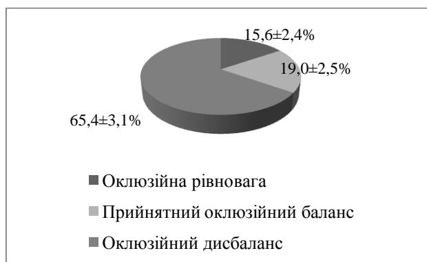
Рис. 1. Результати комп'ютерного аналізу оклюзії в комплексній оцінці ефективності лікування генералізованого пародонтиту

Одночасно комп'ютерний аналіз оклюзії дозволив діагностувати супраконтакти у 100 % хворих. Згідно даних T-Scan лише у 15,6±2,4 % пацієнтів спостерігалась оклюзійна рівновага, яка наближувалась до 50 % – 50 %. Прийнятний баланс 60 % – 40 % відзначався у 19,0±2,5 %. Тоді як у решти 65,4±3,1 % реєструвався оклюзійний дисбаланс, що призводив до функціонального перевантаження зубів на відповідній стороні щелеп (рис. 1). Найбільш часто підвищення оклюзійного тиску спостерігалось для правої сторони щелеп (57,8±3,2 %; p>0,05 ). У 37,5±3,1 % хворих були виявлені контакти зубів, що гіпербалансують, наявність яких пояснювалась, зокрема, виявленими деформаціями зубних рядів.