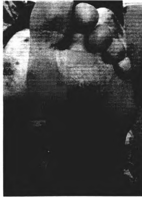
через два месяца от начала лечения