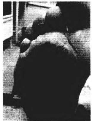
через 2 недели, после 3 уколов