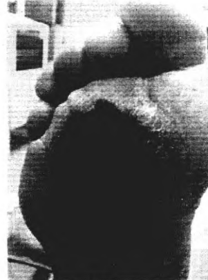
через 5 недель, после 6 уколов