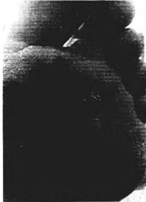
через 1,5 месяца, после 7 уколов