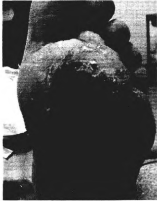
через 2 недели, после 3 уколов