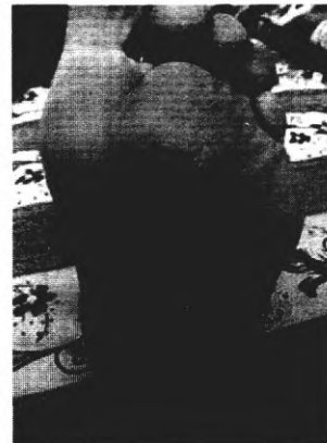
через 1,5 месяца от начала лечения