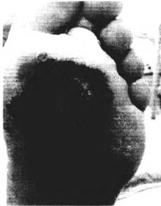
через 5 недель, после 6 уколов