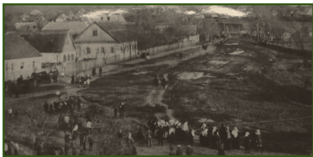
Центральна вулиця Томаківки, де працював земським лікарем Василь Леонтович. Початок ХХ століття