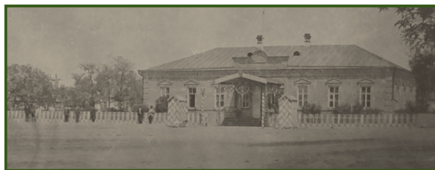
Село Томаківка. Волосне правління. 1903 рік