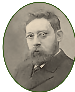
Фізіолог, академік Олександр Васильович Леонтович

Олександра, майбутнього академіка. Ним Василь Федорович пишався і ніжно любив. Про це свідчать кілька листів батька до сина, які, на щастя, збереглися в родині. Мав Василь ще й трьох доньок — Ольгу, Любов та Віру. Помер Василь Леонтович у 46 років. Випускник Катеринославської гімназії став родоначальником цілої династії науковців — докторів наук і академіків, які славили вітчизняну науку.