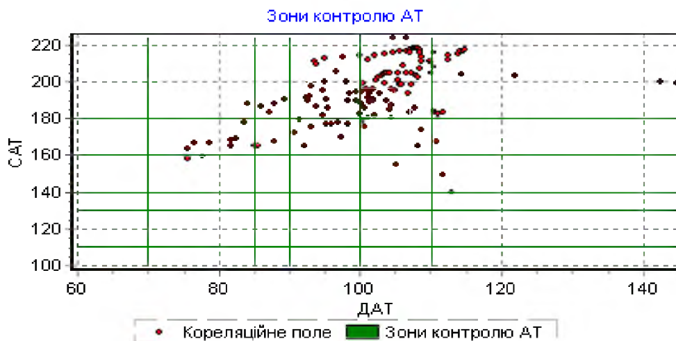
Рис. 2. Добовий профіль систолічного та діастолічного АТ у вигляді зображення кореляційного поля