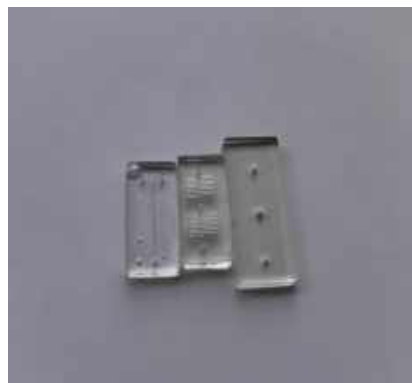
Рис. 3 Різноманітні форми комірок

Мікрофлюїдні канали можуть мати різноманітну форму (прямолінійні, спіральні, сітчасті, мікрореактори, Y-подібні), що дозволяє реалізовувати різні сценарії аналізу: від базових гідродинамічних досліджень до складних хімічних або біохімічних реакцій. Наприклад, спіральні канали активно використовуються для пасивного змішування реагентів, а сітчасті — для паралельної подачі декількох рідин (рис. 3).