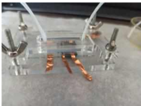
Рис.1. Мікрофлюїдна комірка.

Результати та обговорення. Використовувані в лабораторії кафедри біохімії та медичної хімії мікрофлюїдні пристрої (рис.1) мають гідрофобну поверхню. Тому основна ідея полягала в тому, щоб створити умови, за яких білки плазми максимально розчинні. Для цього комірку після використання занурювали в буферні розчини з різним рН. Потім обробляли в ультразвуковій ванні 10 хв. Така операція повторювалася у кількох чистих розчинах.