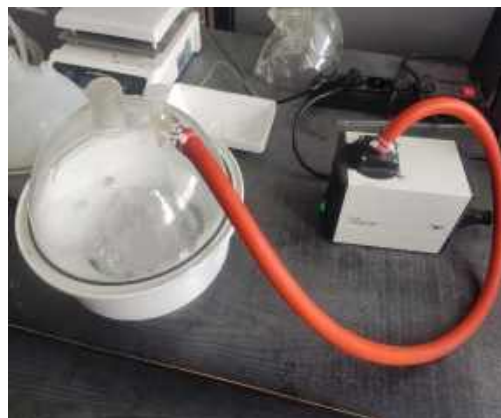
Рис. 2 Дегазація комірки з ПДМС

Мікрофлюїдні канали можуть мати різноманітну форму (прямолінійні, спіральні, сітчасті, мікрореактори, Y-подібні), що дозволяє реалізовувати різні сценарії аналізу: від базових гідродинамічних досліджень до складних хімічних або біохімічних реакцій. Наприклад, спіральні канали активно використовуються для пасивного змішування реагентів, а сітчасті — для паралельної подачі декількох рідин (рис. 3).